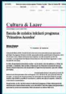
Assesoria de comunicação