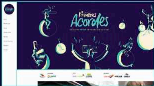
Site do projeto