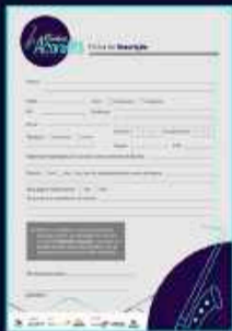
Ficha de Inscrição